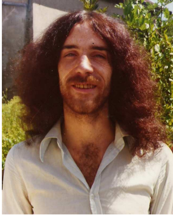
Photo prise en 1977 en France.

Derrière ce sourire il se sait condamné. Le LSD, l'héroïne... a détruit son sang, son foie et son système neurologique est gravement atteint.